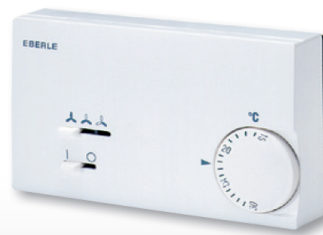
KLR-E 527 21

AC controller for residential and office applications – KLR-E 7000 series