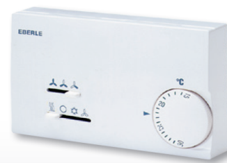
KLR-E 527 22